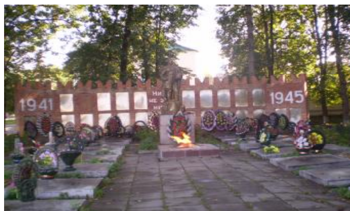
Памятник «Братская могила» - солдатам освободителям «Холм-Жирковского» района в годы ВОВ