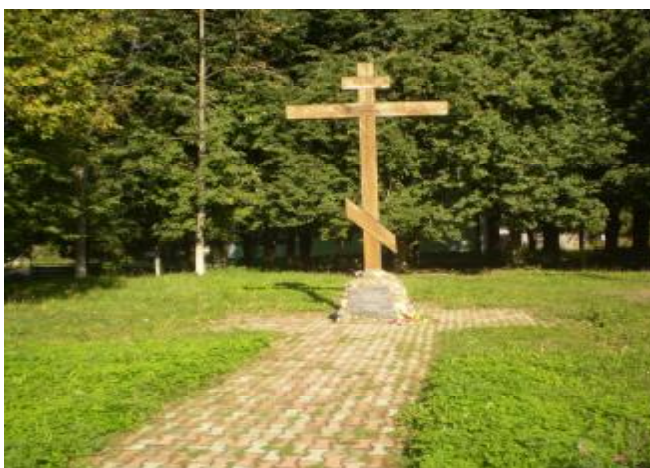
Место захоронения графа Уварова С.С. и генерал-майора Ф.С. Уварова